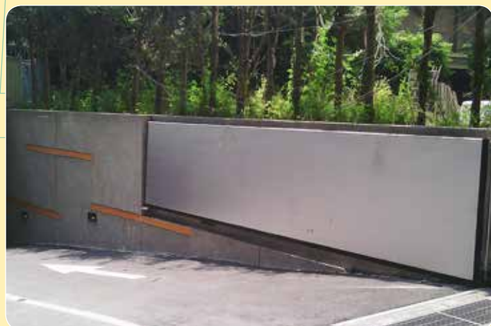
CE-618A 坤福 臺北市政府警察局松山分局、捷運局工程處辦公大樓及松山線捷運設施等共構新建工程