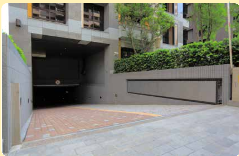
CE-618A 遠雄 內湖米蘭苑 開啟