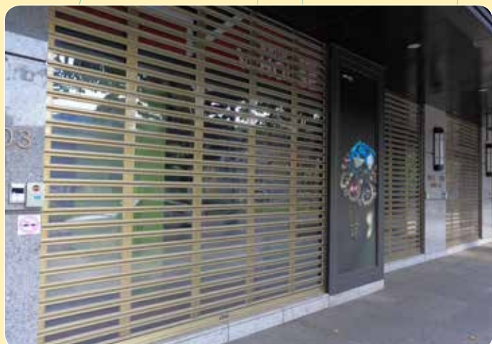
CE-602AG 長虹 內湖虹觀 香檳色