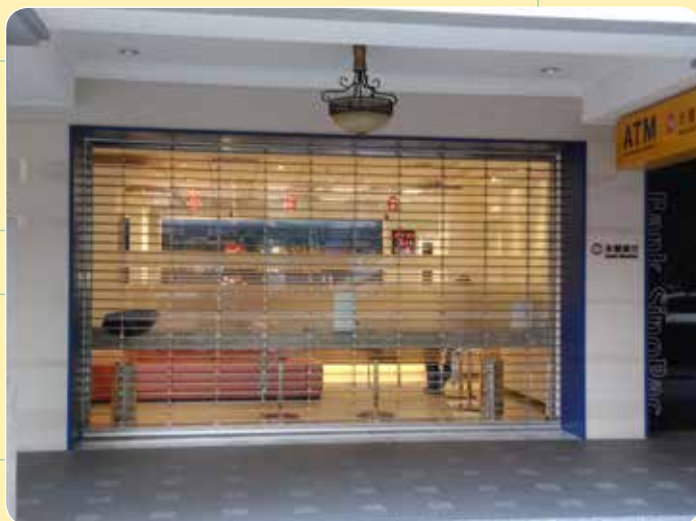
CE-25 永豐銀行 東門分行