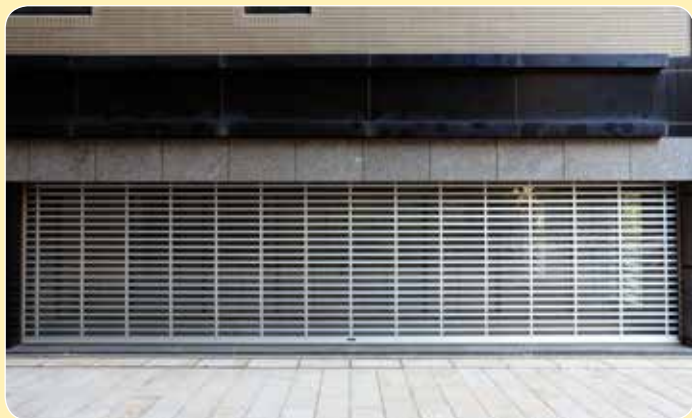
CE-601AP 遠雄 林口未來之都