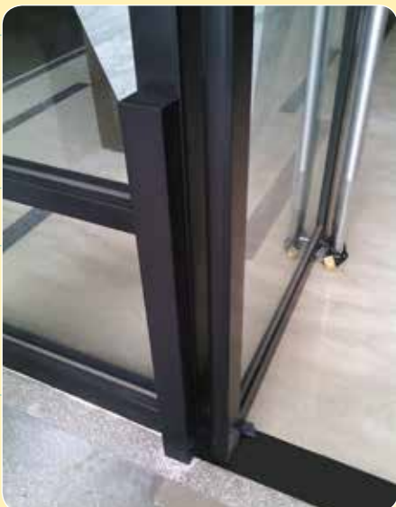
CE-618B 萬企建設 淡水案