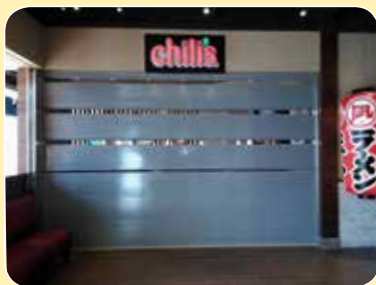
CE-520B 住佳室內裝修 chilis 大直店 烤漆標準色：灰色