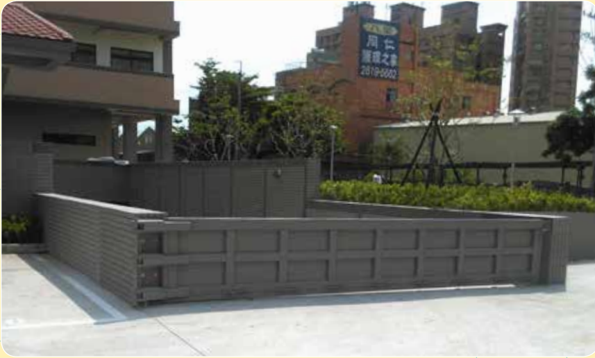
CE-618A 潤泰 八里安老院