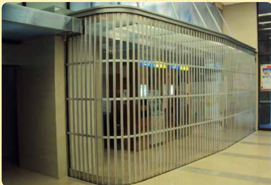
CE-610 永豐銀行 松德分行