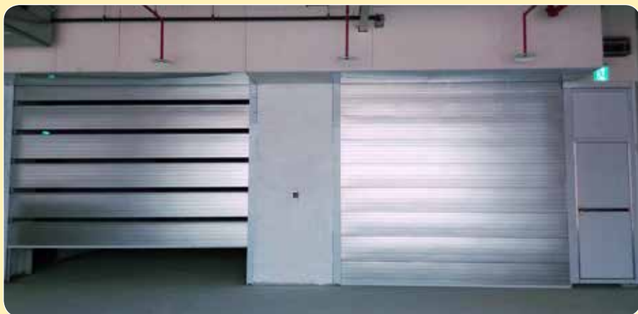
CE-520B、CE-510B 長虹 新時代廣場