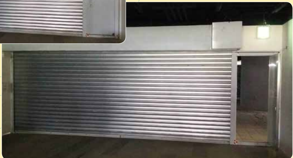
CE-560B 歐遊新莊館汽車商務旅館