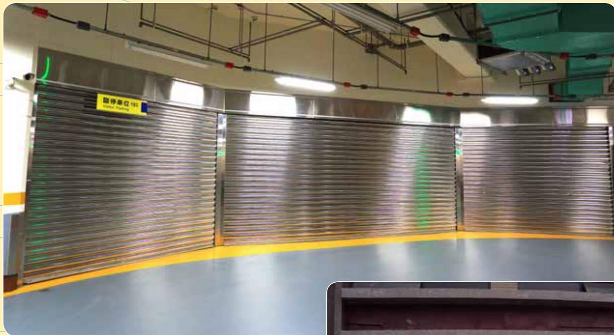
CE-202A 遠雄 O3 總部