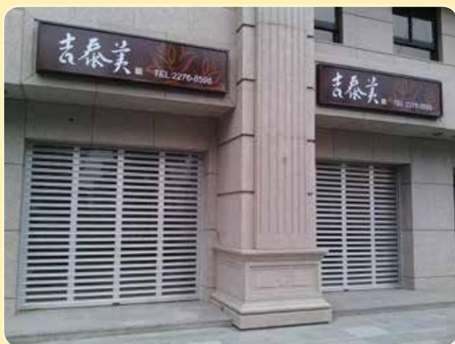
CE-602AG 吉將 新莊吉泰美