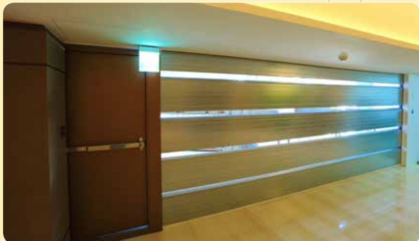
CE-510B 京璽國際 台北市信義區房地產銷售中心